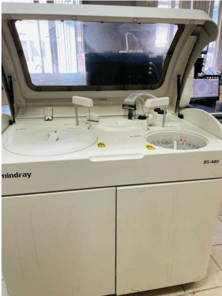
Analizador Bioquímico BS- 480 marca Mindray