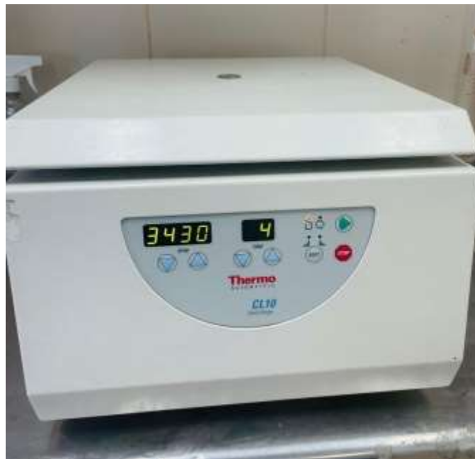
CL 10 Centrífuga