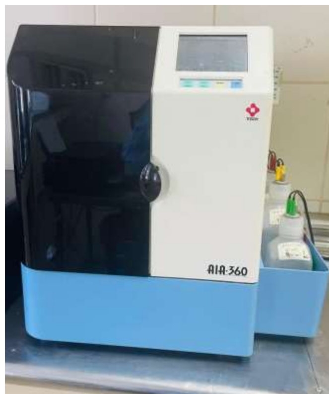
Analizador de inmunoensayo automatizado AIA - 360 marca Tosoh