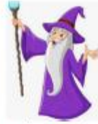
D) un mago