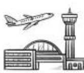
A) Al aeropuerto