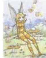
D) no hará nada