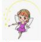
B) un hada