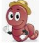
A) un gusano