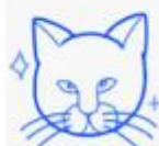
D) los bigotes