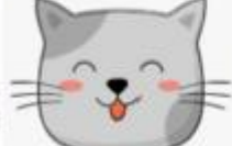
C) la boca