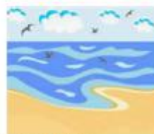
D) Al mar