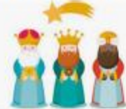
C) los reyes