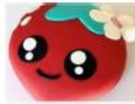
C) quitarle las pecas