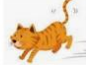
B) el rabo