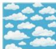
B) A las nubes