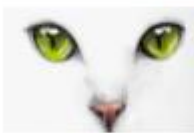
A) los ojos