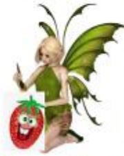
B) ponerle más pecas