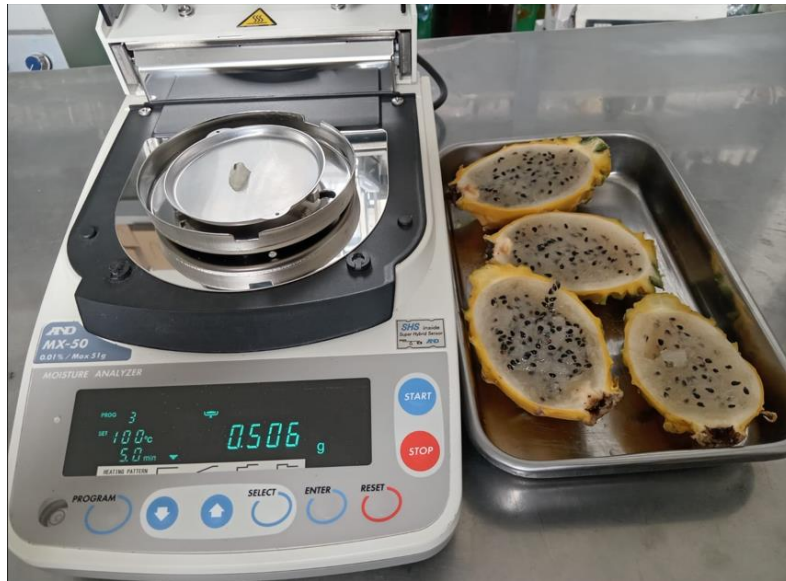
Inicio de la determinación de la humedad de la muestra