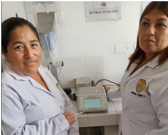
Determinación del Índice de Refracción (IR)