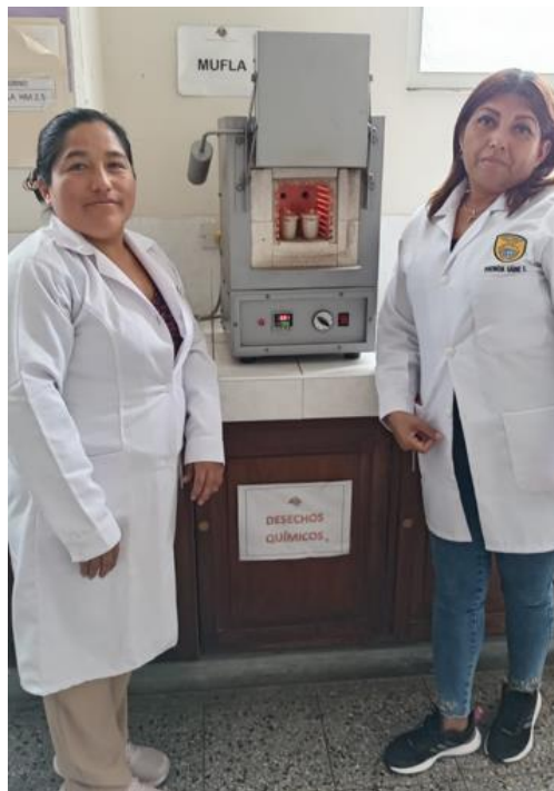
En la mufla ejecutando cenizas totales