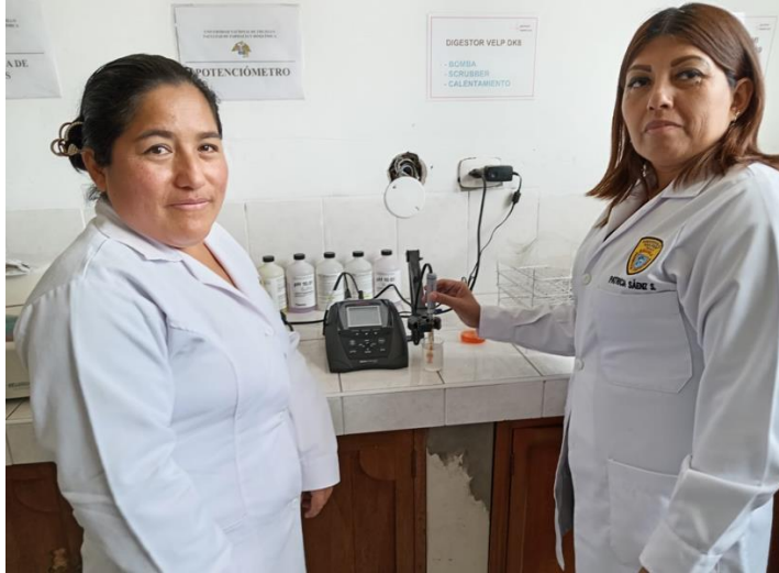
Determinación del pH