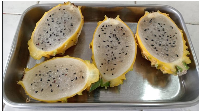
Hylocereus megalanthus (K. Schum. ex Vaupel) Ralf Bauer “pitahaya amarilla”