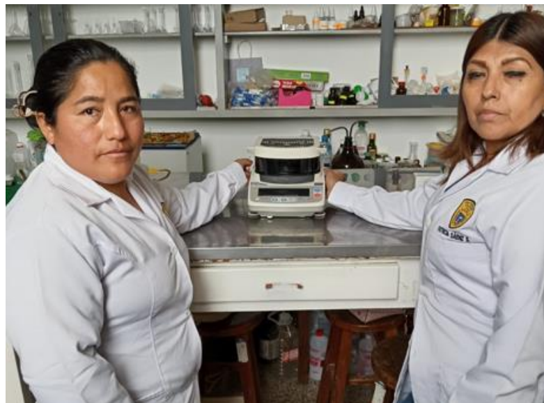
Determinando la humedad de la muestra