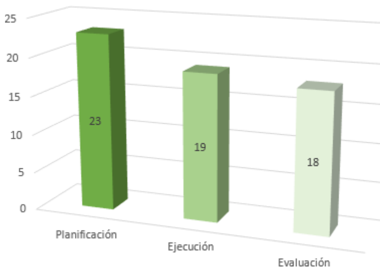
Figura 2 Nivel de desarrollo de los cuentos infantiles en niños de 5 años, Institución Educativa N° 12, San Marcos

El nivel de desarrollo de cuentos infantiles durante 10 actividades de aprendizaje en niños de 5 años, Institución Educativa N° 12, San Marcos, se indica en la Figura 2 con los siguientes resultados: “Planificación” 23 de 30; “Ejecución” 19 de 30 y “Evaluación”, 18 de 30.