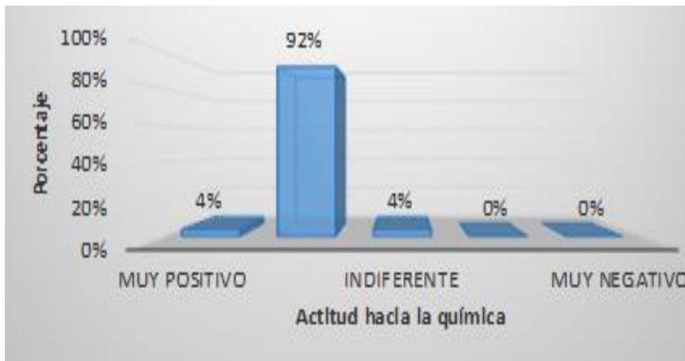
Figura 6: Distribución de frecuencias de la actitud hacia la química con respecto a la dimensión interés por la asignatura de química