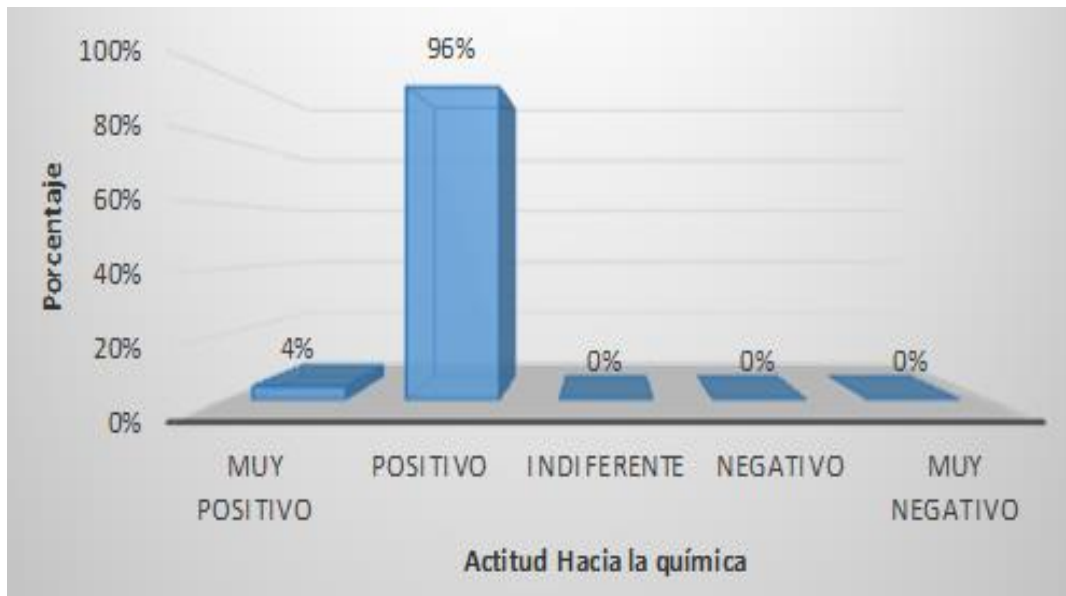
Figura 3: Distribución de frecuencias según actitud hacia la química