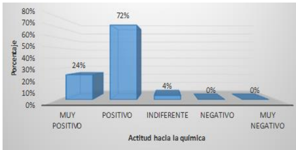
Figura 7: Distribución de frecuencias de la actitud hacia la química con respecto a la dimensión utilidad del conocimiento químico