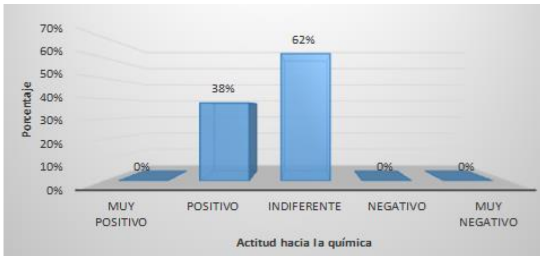
Figura 5: Distribución de frecuencias de la actitud hacia la química con respecto a la dimensión dificultad en la comprensión de la química