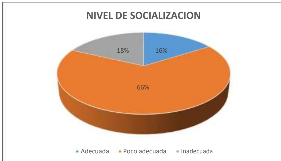
Gráfico 3 NIVEL DE SOCIALIZACION