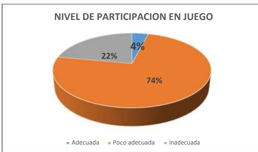
Gráfico 1 NIVEL DE PARTICIPACION EN JUEGO