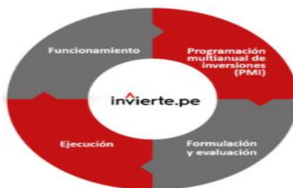
Tabla 01 – Ciclo de Gestión de Inversión Pública